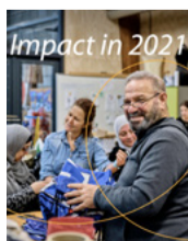
Onze impact in 2021