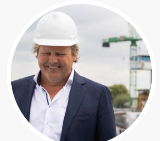
Binnenvaart op batterijen Rabobank